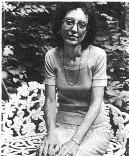
Joyce Carol Oates.

Les cinq filles de la famille Zinn — quatre vraies filles, Constance Philippa, Octavia, Malvinia, Samantha, et une fille adoptive, Deirdre, ont toutes l'âge d'être mariées. Malheureusement, déplore la chroniqueuse de cette tragique histoire, 1 les filles Zinn n'ont pas vraiment la fibre matrimoniale. Deirdre disparaît en ballon et devient médium, Malvinia s'enfuit avec un acteur pour embrasser la carrière théâtrale. Samantha demeure l'assistante de son père (inventeur de la chaise électrique) jusqu'à ce qu'un amour fou la fasse fuir, elle aussi, à un moment où Constance Philippa a depuis longtemps choisi de disparaître la nuit de ses noces. Il reste Octavia, aimante et douce, qui se destine à « la seule carrière ouverte aux femmes, écrivait encore Virginia Woolf quelques décennies après l'époque de cette chronique, le mariage. » Mais même cette carrière se révèle pleine d'embûches.