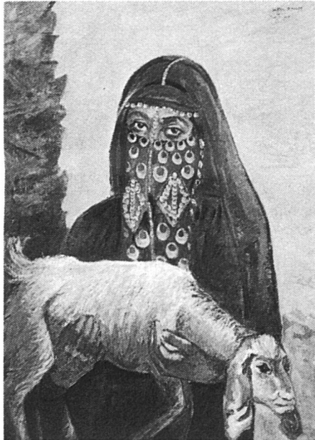
Tableau de Safeya Binzagr, artiste séoudienne installée en Egypte.

Des nombreuses interviews de paysannes de la Haute-Egypte et du Delta, des faubourgs du Caire et d'Alexandrie, il ressort que la femme égyptienne porte sur elle un regard dont le caractère contradictoire ne peut que frapper notre logique occidentale. A la fois, elle constate