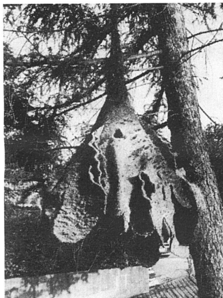
Tarnung, 1981, laine et sisal.

la création de nouvelles structures garantissant aux hommes et aux femmes des droits égaux de participation, ainsi que le proposait récemment un membre de notre section.