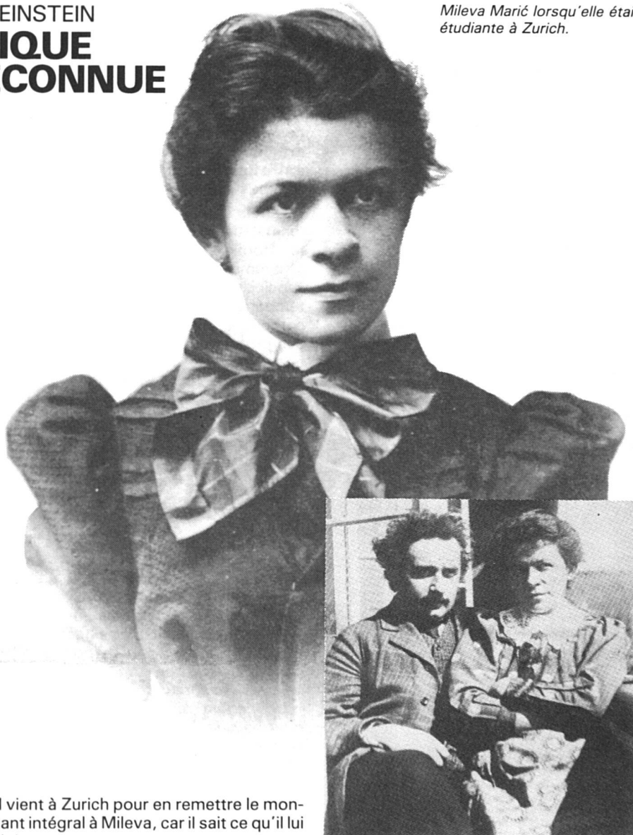
Mileva et Albert Einstein à Berne.

Mileva Marić lorsqu'elle était étudiante à Zurich.