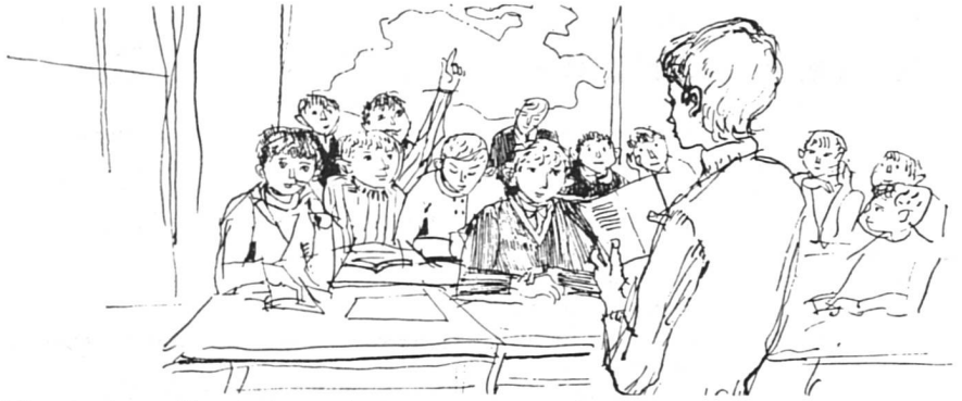
Célibataire ou mariée, c'est toute la différence.