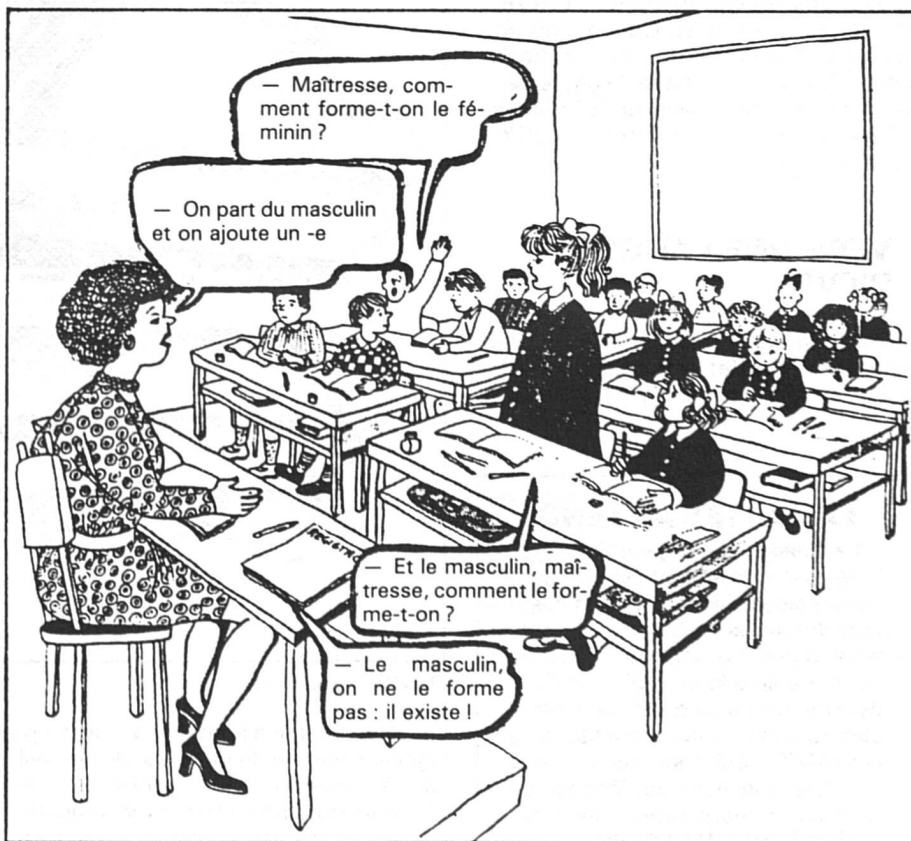
Dessin tiré de « Croce Rossa Svizzera »