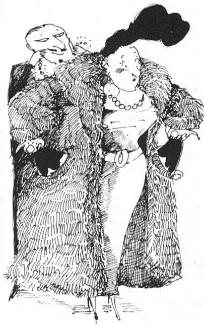
La femme mariée Pauvreté invisible

Anne Wilsdorf, Agenda des Femmes , 1987.