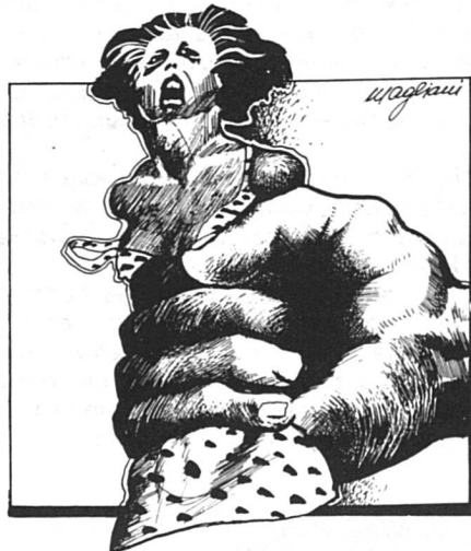
Mulherio, mars-avril 1982.

Ras le viol : le slogan frappe les esprits et permet de prendre conscience d'une aberration liée à l'image de la femme dans notre société. Très bien. Mais insuffisant pour changer les mentalités, tant il est vrai qu'aujourd'hui encore, trop de femmes éprouvent un sentiment de honte et de culpabilité face aux actes de violence dont elles sont les victimes. Elles préfèrent souvent taire l'ignominie,