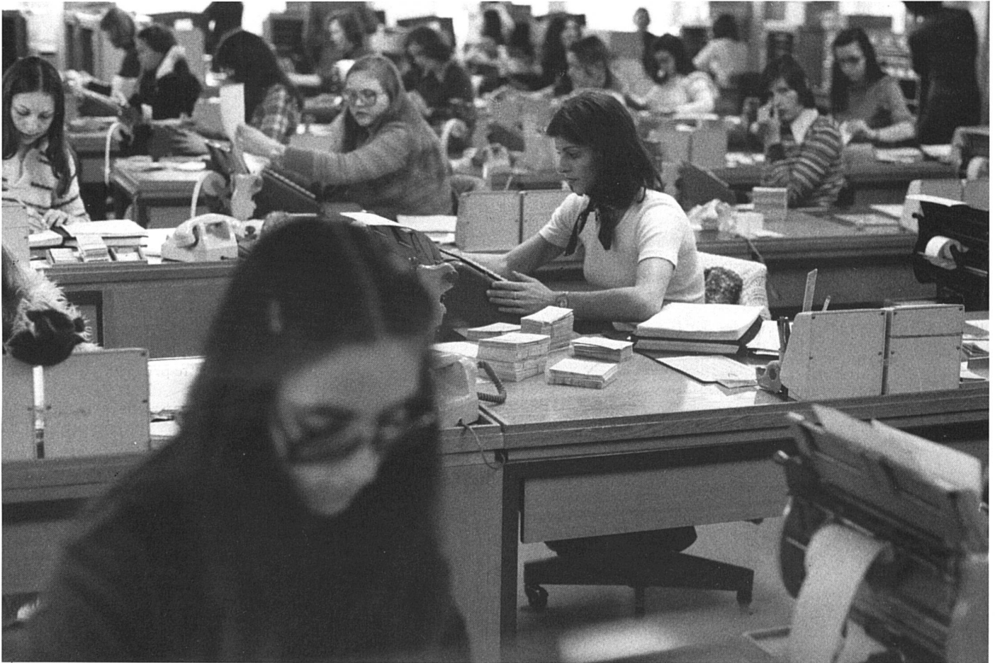
Métier mal payé = retraite rabotée.

Maintenant que j'ai passé l'âge de 62 ans, je touche la moitié de la rente de couple. J'ai bien sûr demandé de toucher ma part en mon nom propre. On me dit que la plupart des femmes mariées n'osent pas encore faire cette demande, de peur de froisser la susceptibilité de leur mari ou par crainte du qu'en dira-t-on. Pourtant, pour beaucoup, ce pourrait être la première fois de leur vie qu'elles auraient de l'argent en leur