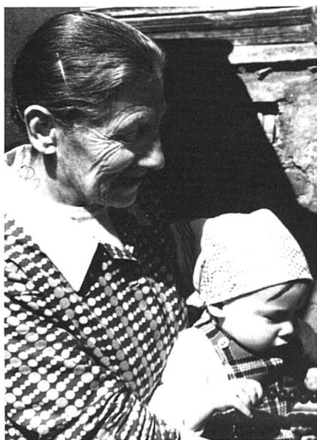
La petite fille sera-t-elle mieux lotie que la grand-mère à l'âge de l'AVS ?

C'est dans le cadre de l'AVS que l'on constate les inégalités les plus frappantes en fonction du sexe mais aussi, parmi les femmes, en fonction de l'état civil. On sait par ailleurs que la révision du système de l'AVS est actuellement au centre du débat politique. Aussi est-ce au 1er pilier que nous consacrerons la partie la plus importante de ce dossier.