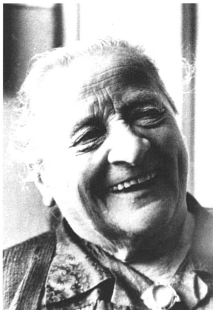
Une retraite digne pour sourire à la part de vie qui reste.

Tout d'abord, il y a le problème des droits de la femme divorcée au décès de son ex-mari lorsque ce dernier est tenu de lui verser une pension alimentaire, que le mariage a duré au moins 10 ans et que l'ex-épouse est âgée de 45 ans au moins.