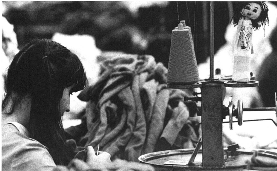
Une tentation pour les jeunes filles : encaisser leur avoir de vieillesse au moment du mariage.

Il faut cependant se rendre bien compte que, pour garantir à toutes les femmes une retraite digne, c'est leur place dans le monde du travail qu'il faudrait changer.