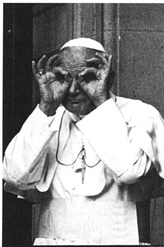
Un discours fermé à tout débat éthique.