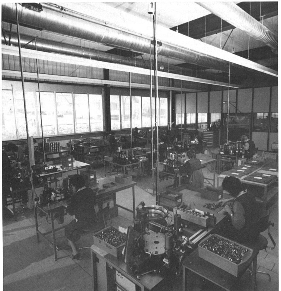
Le dimanche aussi ?

Dans ces conditions, les syndicats sont contraints de louver entre la défense des droits acquis de leurs membres et l'adéquation à des impératifs économiques dont ils ne peuvent pas se désintéresser. Il est vrai que, toujours selon le BIT, il n'a