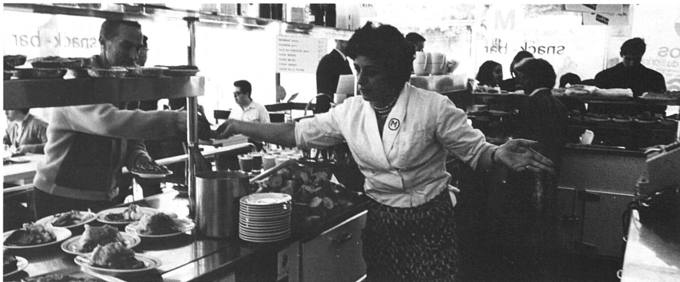
Flexibles depuis longtemps : les travailleuses de la restauration.