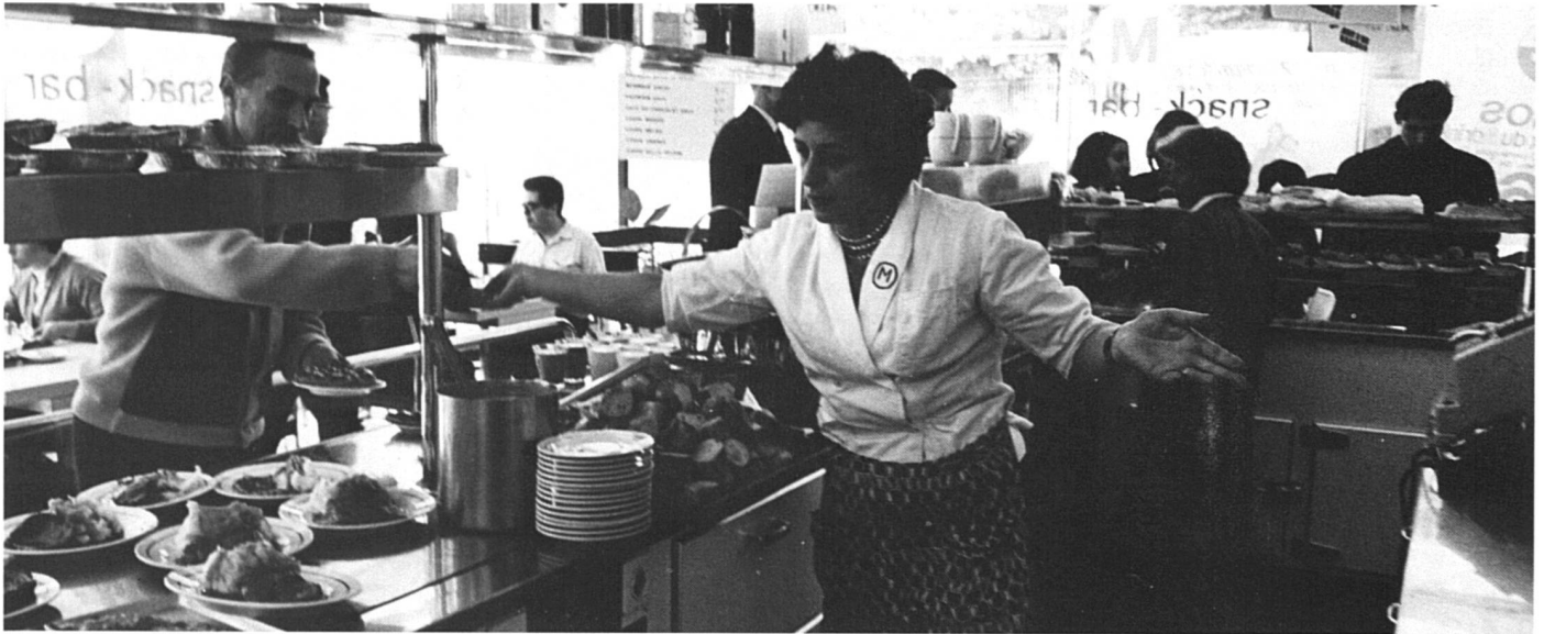
Flexibles depuis longtemps : les travailleuses de la restauration.