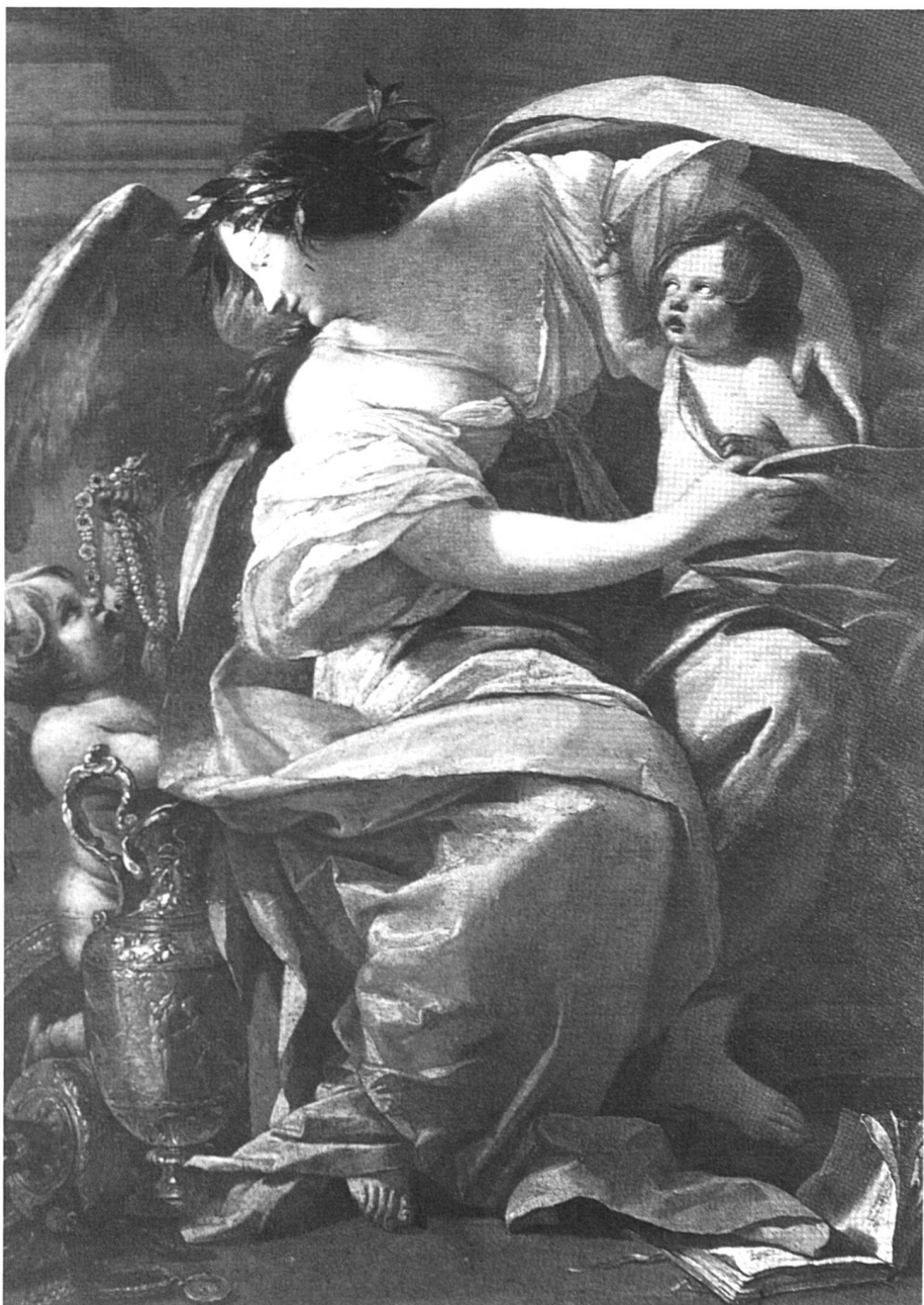
La Richesse, par Simon Vouet - Musée du Louvre.

Il peut alors déclarer à deux témoins ses dernières volontés. Ces témoins doivent en