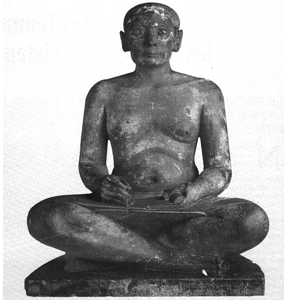
Le scribe égyptien.

● Le legs est l'attribution d'une somme, d'un bien (mobilier ou immobilier) ou