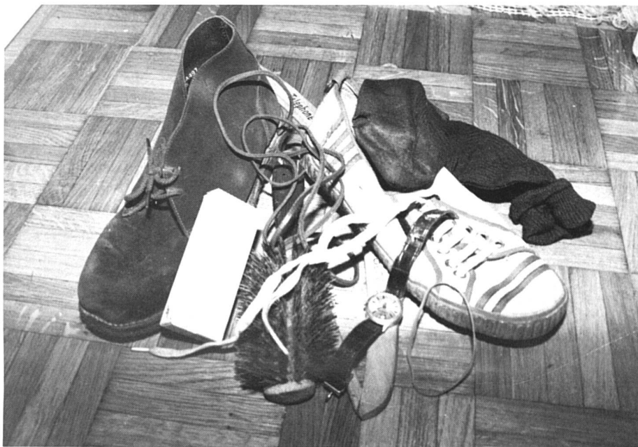
A chacun son bien.

Dans le nouveau droit matrimonial, chacun des époux sera donc créancier envers son conjoint de la moitié du bénéfice réalisé par ce dernier durant le mariage. Cette créance peut toutefois être compro-