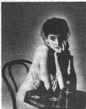
ÊTRE POMMERY, C'EST TOUT UN ART.

"Le Champagne de la reine" Philippe Jeunon S.A.