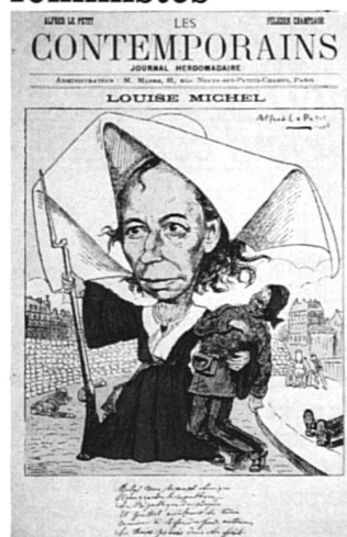
Louise Michel, « la nonne rouge », caricature de 1880.

La Bibliothèque Marguerite Durand, à Paris, édite une série de 7 cartes postales reproduisant des documents anciens appartenant à ses collections. Voilà qui va faire plaisir aux collectionneuses de documents relatifs à l'histoire des femmes. Ces cartes peuvent être commandées à l'Agence culturelle de Paris, 6, rue François-Miron, 75004 Paris. (Prix : FF 2.50 la pièce).