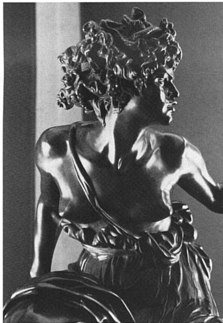
La Pythie, 1870.

Henriette Bessis avait en 1980, pour le Musée de Fribourg qui lui consacrait une exposition, décrit son destin de sculpteur et de peintre, donné à lire ses bonheurs et ses angoisses de création, relevé ses indéniables réussites et ses faiblesses dans la collection d'œuvres que Marcello a laissée. « Son talent est incontestable, écrivait-elle, et elle s'est, progressivement, débarrassée des influences dont elle était inconsciemment imprégnée. »**