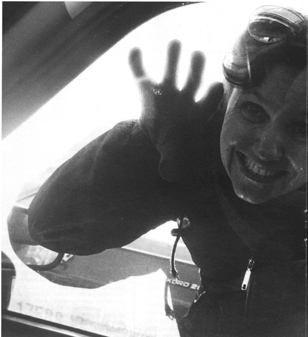
« Des paroles aux actes » : seulement pour celles qui en veulent ?

même la possibilité de travailler à temps partiel, ouverte en théorie aussi aux hommes, intéresse avant tout les femmes. Elle repose également le problème de la flexibilisation des horaires, qui tend à satisfaire d'abord les besoins des employeurs. La fabrique de biscuits Kambly, dont la production varie fortement selon la saison, a mis au point sous le couvert de « Taten