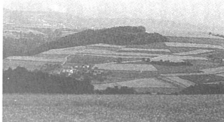
Améliorer la protection des paysages naturels.

Ni l'une ni l'autre n'ont trouvé grâce devant la majorité des parlementaires fédéraux. Ni l'initiative non plus, qui a été balayée au Conseil national par 100 voix contre 48 et au Conseil des Etats par 37 voix contre 2.