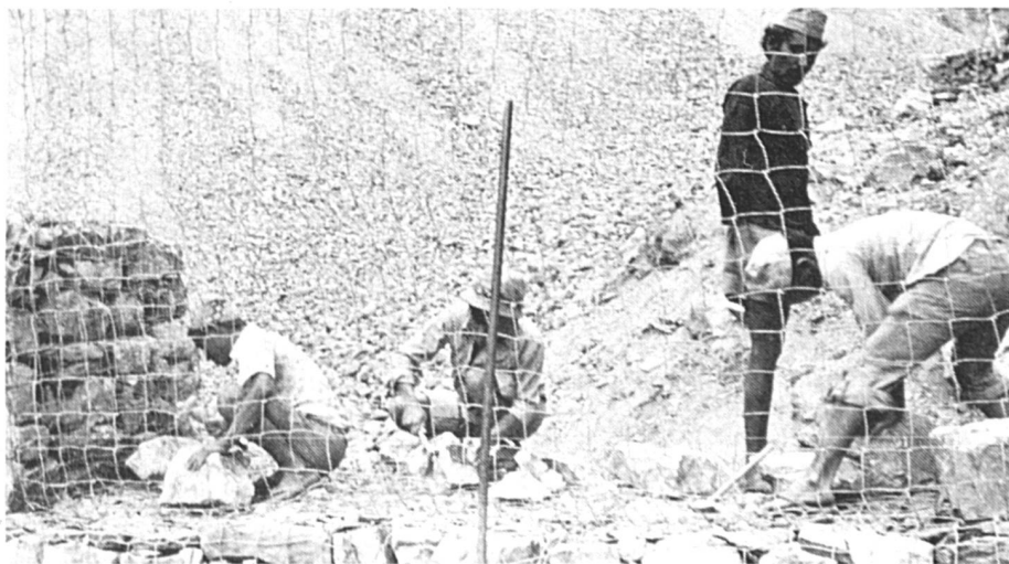
Les travailleurs étrangers : indispensables dans la construction.

L'Action nationale a déposé son initiative « Pour la limitation de l'immigration », appuyée par près de 113 000 signatures, en avril 1985. Il s'agit de la sixième initiative xénophobe déposée depuis les années septante.