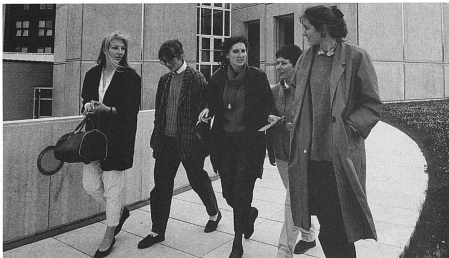
Etudiantes de l'Université de Lausanne : pourquoi ne grimpent-elles pas ?

Afin de compléter ce tableau, quelques chiffres montrant la perte de vitesse des femmes au fur et à mesure de l'ascension dans la hiérarchie académique. En 1986, 44,4 % des élèves à avoir une maturité en poche sont des femmes. Elles sont 40,2 % de celles/ceux qui s'inscrivent à l'université, 35,9 % de celles/ceux qui passent le cap de la première année et 32,4 % de celles/ceux qui vont jusqu'à la licence. Seulement 19,9 % des jeunes qui se lancent dans l'aventure du travail de doctorat sont de sexe féminin.