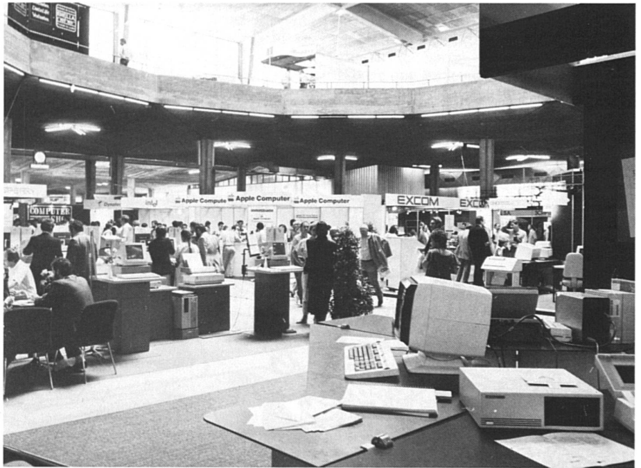
Le Salon de l'informatique à Lausanne : moins de visiteuses que de visiteurs.

Le temps ne profite pas seulement à la banalisation de l'ordinateur, mais aussi à la précocité de sa familiarisation. Pour tous les spécialistes ou travailleurs de la branche, l'ordinateur est beaucoup plus une affaire de génération que de sexe. « Pour une femme de cinquante ans, l'informatisation de la profession peut être vécue comme un drame » avouent en termes quasi-identiques une secrétaire, une agente immobilière et une laborantine. Pour les générations à venir, en revanche, l'angoisse de la nouveauté sera balayée, et les complexes avec. Si l'informatique ne constitue pas à l'école une discipline en tant que telle, elle est assez largement introduite pour que tous les enfants actuellement scolarisés y soient au moins sensibi-