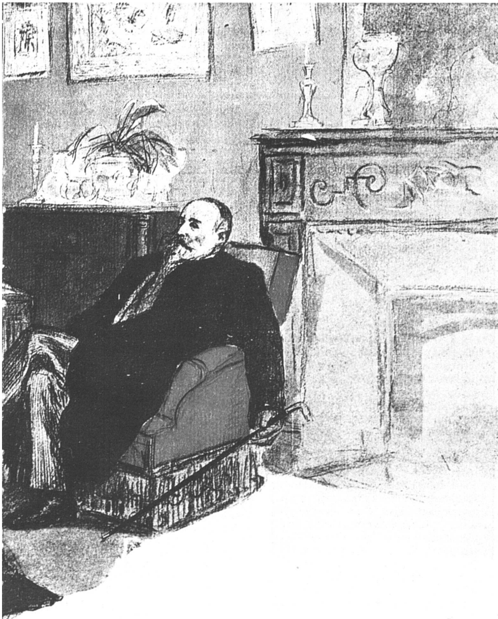
L'entremetteuse, la « fille » et le client dans une caricature de la Belle Époque.

La plupart des prostituées, les quelques clients qui se sont confiés à la télévision ou aux journaux, dénoncent en bloc la frigidité et le manque d'intérêt des épouses, la nécessaire division du travail sexuel : on ne fait pas avec sa légitime ce que l'on fait avec une pute. Pourtant tous et toutes affirment rester dans une sexualité sinon propre en ordre, du moins à la papa. Les hommes iraient chez les prostituées pour pouvoir prendre leur temps contrairement à ce qui se passe chez eux, pour ne pas perdre de temps en préliminaires, ne pas avoir à se soucier de la jouissance de l'autre, faire « ça » avec une vraie spécialiste, oser la fellation et les très populaires caresses à