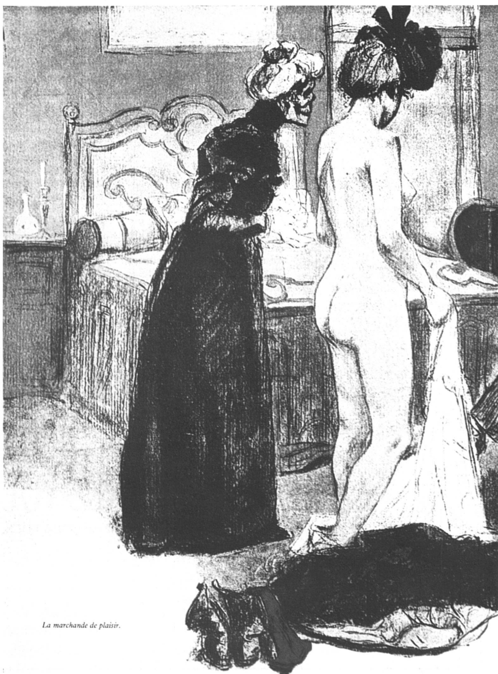
La marchande de plaisir.

Dans la civilisation occidentale, les femmes, historiquement, ont été vendues ou échangées en vue de la procréation et de la reproduction immédiate. Cela a été aggravé par le christianisme qui voulait que la femme soit la servante de l'homme, comme celui-ci était le serviteur d'un Dieu interdisant la « fornication » dans le mariage. Mais les femmes n'étaient pas uniquement reproductrices ; elles étaient le fétiche, elles servaient de passe entre les hommes. Devenues monnaie vivante, elles devaient