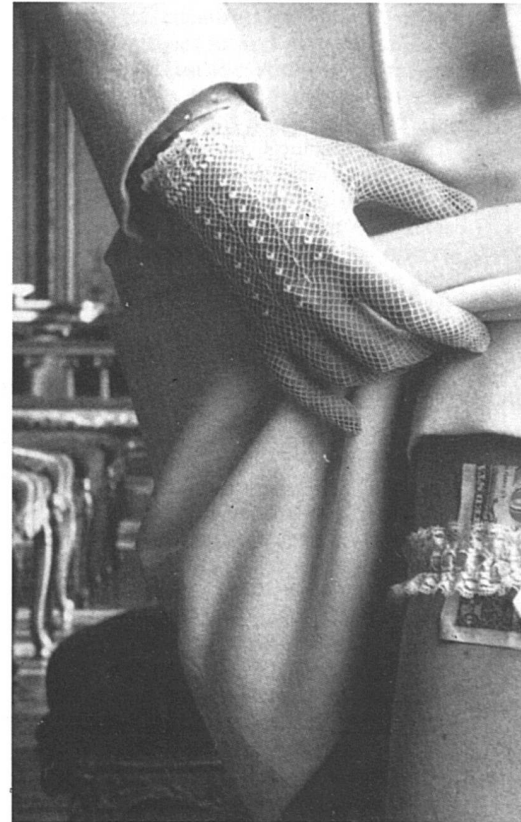
La mariée, toujours une femme honnête ?

je lui objecte que le rapport mécanique avec le client me semble peu gratifiant, elle répond qu'il y a plusieurs sortes d'orgasmes, un mécanique lors du boulot, un avec l'ami et un autre encore avec certains clients quand elle n'a pas d'ami. Elle dit être entrée dans la prostitution par manque de choix. Elle n'avait pas de foyer, pas de réelle scolarisation. Avant de se prostituer elle a été femme de ménage et ne voit pas de différence si ce n'est financière. Elle se livre à une prostitution qu'elle qualifie d'artisanale : peu de clients, des horaires légers, une fidélisation de clientèle avec prix flexibles. Les autres professions qu'elle aurait pu choisir l'auraient usée physiquement, car elle n'est pas toute jeune, alors qu'ici elle peut travailler à mi-temps et vivre à plein temps. Si elle vend de l'illusion elle se targue de le faire au mieux de ses possibilités. Quant aux clients, pour elle on ne rencontre que ceux que l'on cherche et sa clientèle est à la mesure de sa pratique. Les hommes, elle en est certaine, viennent chez elle pour ne pas tromper leur femme, car il est dans la natu-