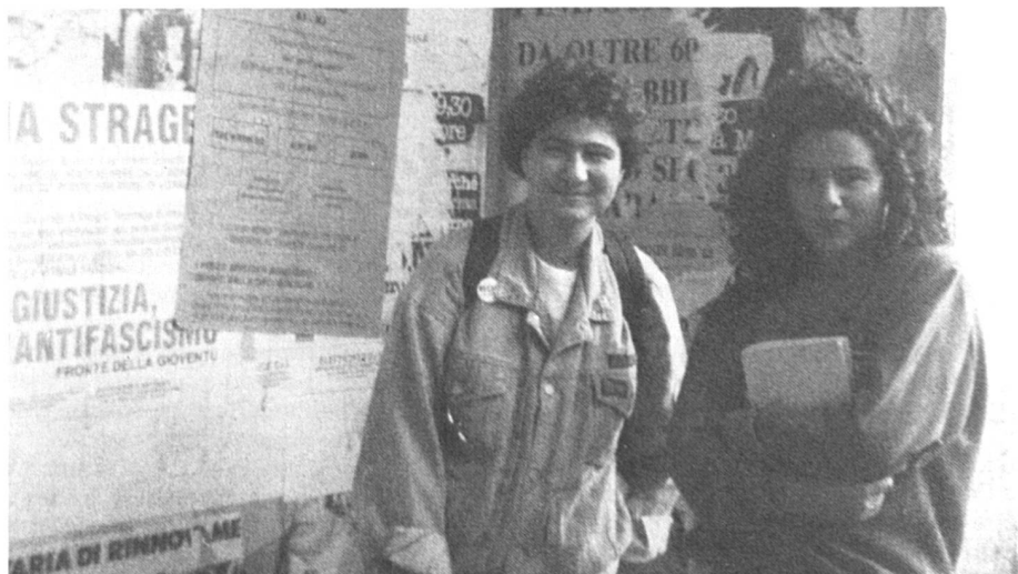
La scolarisation des filles fait des progrès foudroyants.

Les femmes plus âgées, nées trop tôt pour pouvoir profiter de cette évolution, ont néanmoins pu bénéficier d'un accroissement spectaculaire de l'offre en matière de formation continue. Par exemple les