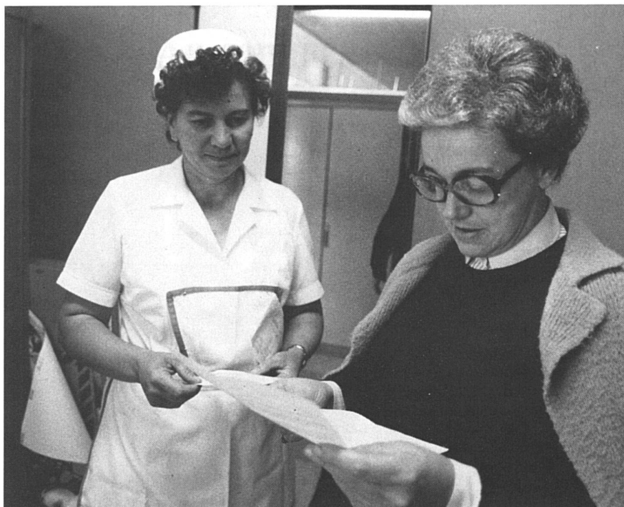
Taux d'activité : tendance à la hausse