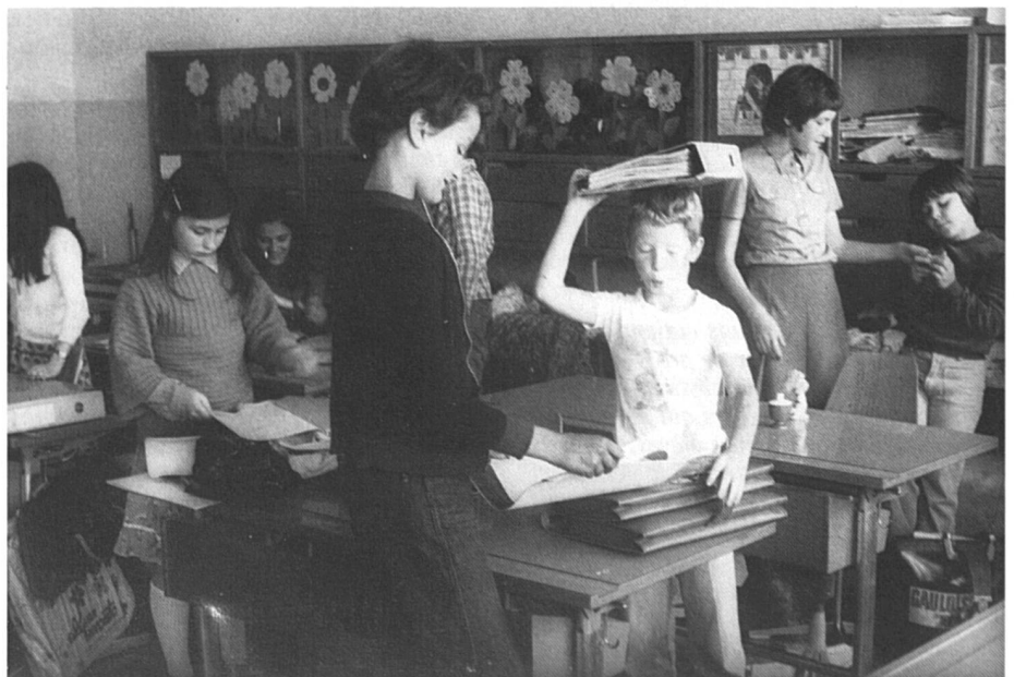
La mixité, fer de lance du modernisme.