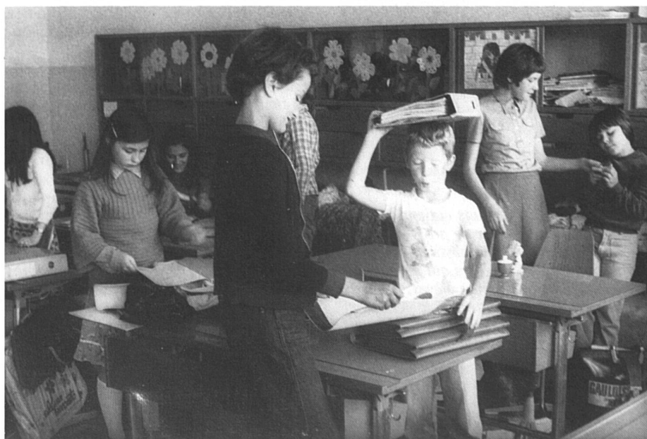
La mixité, fer de lance du modernisme.