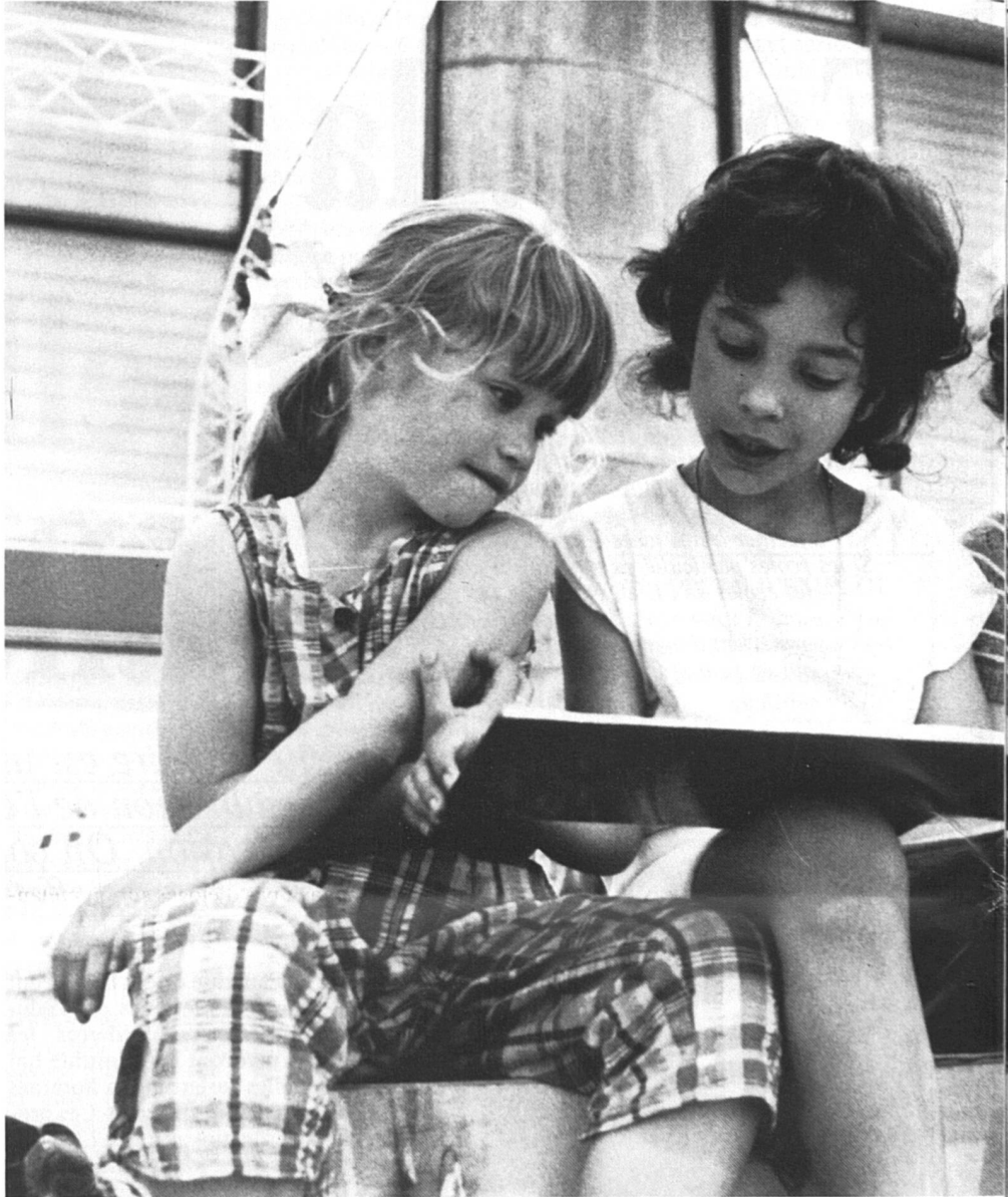
Les filles sont plus vite mûres dans le domaine intellectuel.

Un enseignant d'un collège de jésuites, privé et cher, a découvert voilà trois ans la mixité : « C'est formidable ! Tout d'abord parce que les filles sont plus scolaires et travailleuses. Elles réussissent en général mieux dans toutes les matières et entraînent les garçons. Ensuite, eh bien, les garçons découvrent d'autres attitudes que la brutalité ou la force dite virile, d'autres sports que le rugby et le football. »