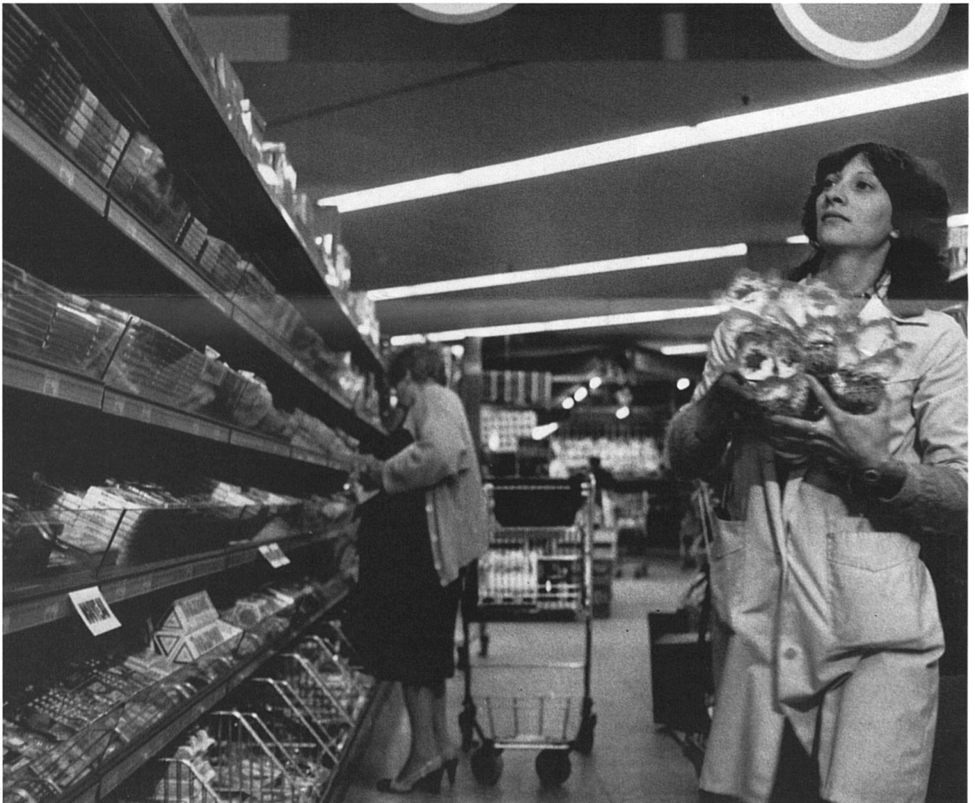
Vendeuse dans un supermarché : un budget précaire.

La mère de famille qui divorce est obligée de se remettre à travailler, ou d'augmenter son activité professionnelle. En effet, la pension alimentaire due par l'ex-mari pour l'entretien des enfants ne suffit bien évidemment pas à éviter une chute dramatique du niveau de vie 5 . Quant à la pension alimentaire pour la femme elle-même, qui ne peut de toute façon être octroyée, selon la législation actuelle, qu'en cas de non-culpabilité de cette dernière, la pratique des tribunaux est beaucoup trop restrictive, déplore Marianne Bovay, vice-présidente de l'Association genevoise des familles monoparentales. « Les juges disent aux femmes : Madame, vous avez une