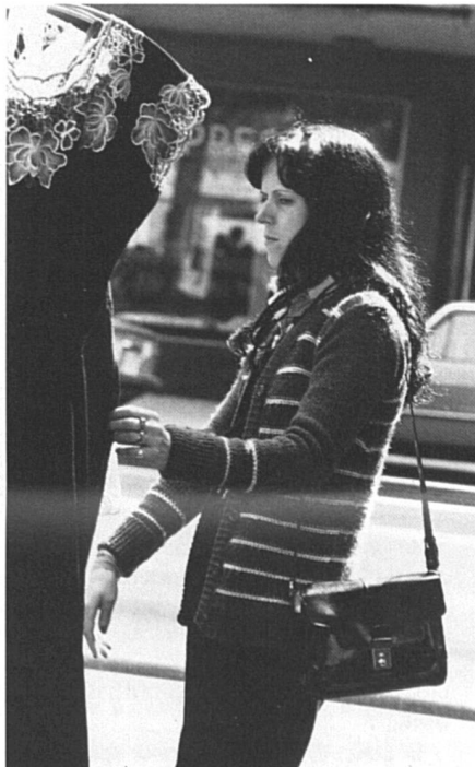
Frais généraux pour le mois : 590 francs.

Jusqu'en 1980, la majorité des demandes d'aide reçues à Fribourg provenait de personnes âgées. Aujourd'hui, cette catégorie de demandeurs est moins importante, en revanche le nombre des femmes jeunes, seules, avec enfants, ne cesse d'augmenter. Sur 706 personnes assistées en 1987, les hommes étaient encore majoritaires (53 % contre 47 % de femmes), et parmi les causes du recours à l'assistance on ne comptait « que » 46 cas de « responsabilité parentale » (mères seules ne recevant pas de pension alimentaire), mais la tendance est malheureusement à la hausse.