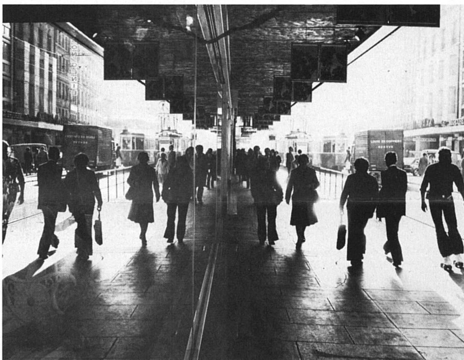
Dans les grandes villes, tout coûte plus cher et il y a moins de solidarité. (Photo de J.-P. Landenberg tirée du livre « Prière joindre photo qui sera retournée », avec textes de F. Klopfenstein, éd. Intervalles)

Peut-être parce qu'une telle approche remet en cause trop de structures fondamentales régissant le statut des femmes et les rapports entre les sexes dans notre société ? C'est ce que feront probablement