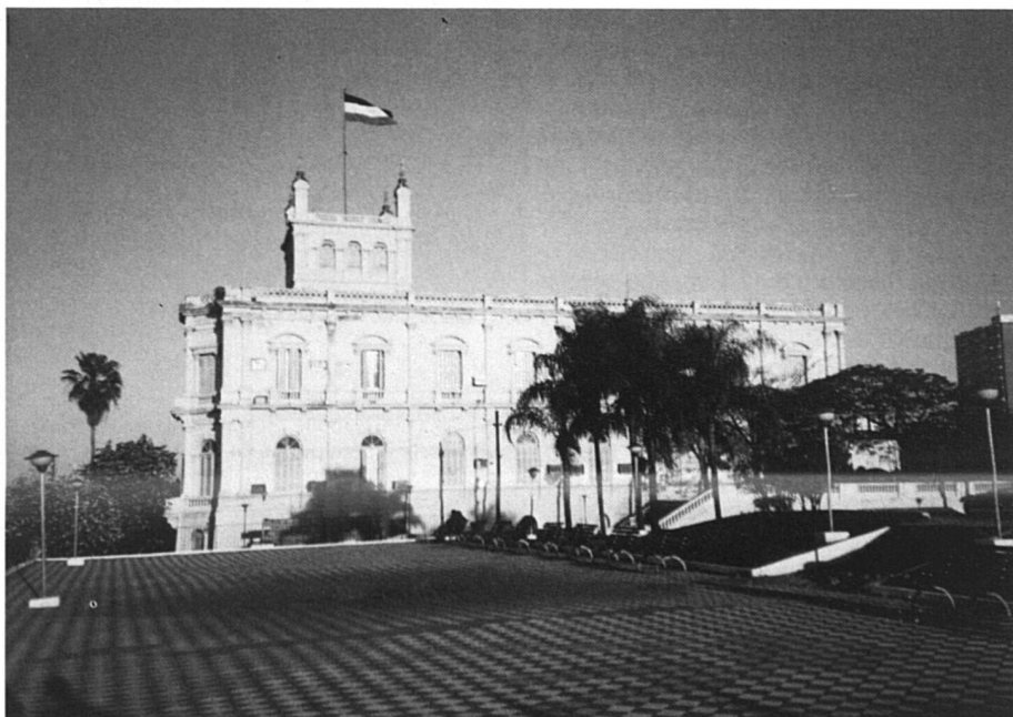
Le palais présidentiel à Asunción.

Plusieurs réseaux d'adoption « légale » de bébés ont été découverts récemment, bébés achetés ou volés puis exportés vers