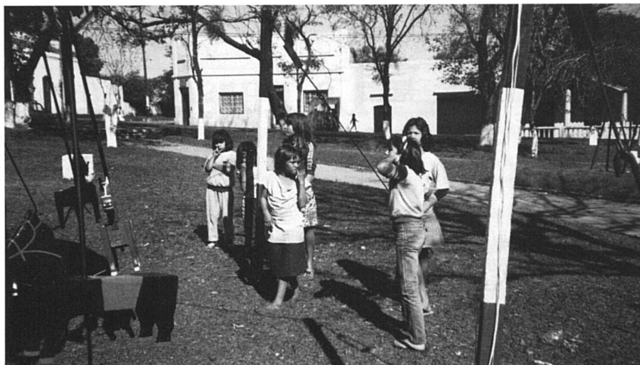
Fillettes autour d'un manège poussé à la main, un dimanche matin à Asunción.

Docteur honoris causa de l'Université d'Asunción, elle est une célébrité nationale pour avoir été la première femme journaliste et la première speakerine à la radio. Son message pour « Femmes Suisses » : que vienne un féminisme féminin et non un machisme féministe !