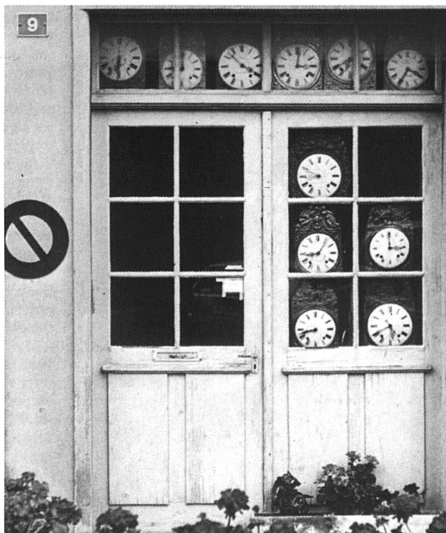
Articuler les différentes temporalités.

D'après l'étude lausannoise, chaque individu vivant en société cherche à articuler d'une manière ou d'une autre les différentes temporalités dans lesquelles il ou