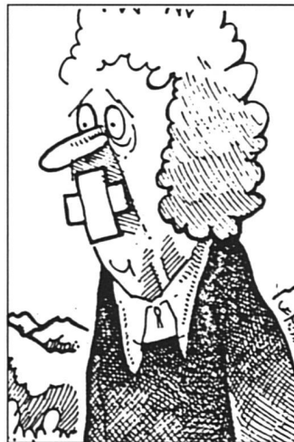
Un dessin réalisé par Barrigue en 1982, qui n'a hélas rien perdu de son actualité...

Suisse d'origine, elle n'est d'Appenzell que par son mariage. On fait courir sur elle des rumeurs songères, et le jour où elle a déposé son recours, on a lancé une pierre dans la vitrine de son magasin de céramiques.