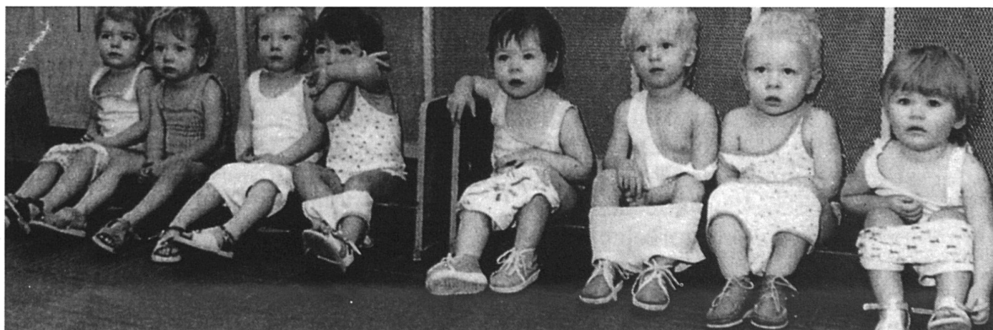
Crèche en RDA: apprendre à faire pipi au bon moment...