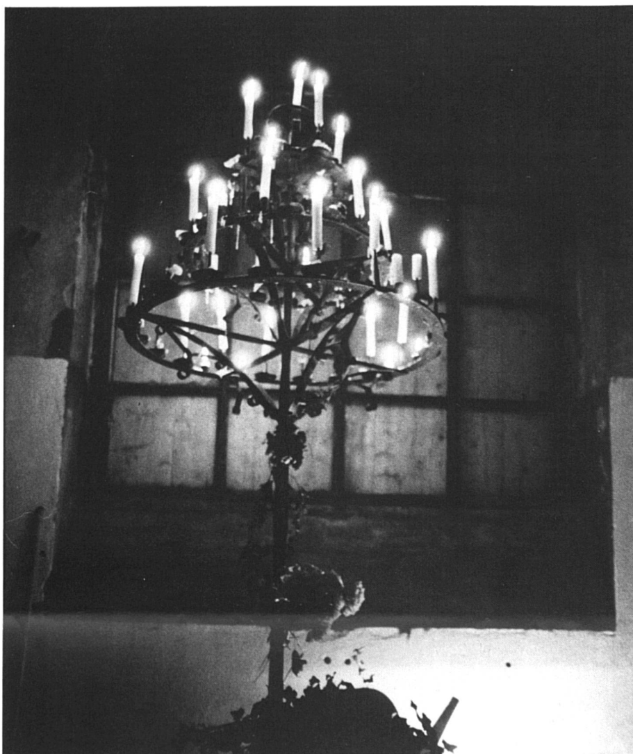
Pour éclairer notre lanterne...