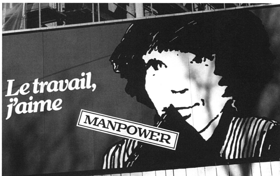
Les Suisses et le travail, un amour qui évolue...