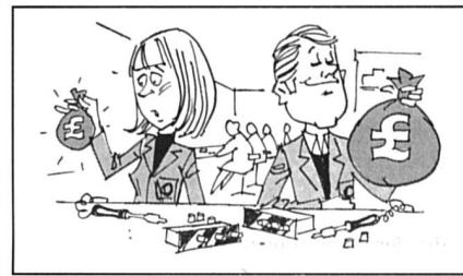
Une caricature éculée? (ici en version britannique). Voire...