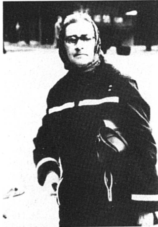
Elena Bonner et Andreï Sakharov à Gorki.

Il n'a jamais combattu dans la clandestinité, mais ce n'est qu'avec l'arrivée de Gorbatchev au pouvoir et la perestroïka qu'il a pu sortir du long exil où il avait été confiné, et non condamné, car il n'y avait jamais eu de jugement.