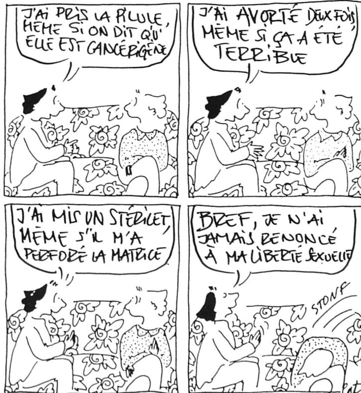
Dessin tiré de Donnavanti, déc. 1989.

Médecine et Hygiène du 5 avril 1989 a publié et analysé les statistiques et tous les chiffres officiels relatifs aux IVG pratiquées en Suisse ces dernières années. Le nombre global a passé de 15 415 en 1982 à 14 190 en 1986. Les disparités cantonales sont énormes. Les six médecins spécialistes qui se sont penchés sur ces chiffres sont en faveur d'une décriminalisation complète qui leur paraît cependant hors de portée, et appuient dès lors la solution fédéraliste comme la seule permettant de mettre de l'ordre dans cette question trop longtemps controversée. Mais vu le refus du Parlement, l'avortement est toujours régi en Suisse, sur le plan légal, par les articles 118 à 121 du Code pénal, datant de 1942, qui font de l'interruption de gros-