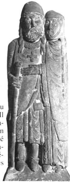
Le retour du croisé.

La grande historienne du Moyen Age Régine Pernoud ajoute un livre passionnant à son œuvre déjà considérable. Elle y donne une image nouvelle des croisades, car elle y introduit la présence et le rôle des femmes, tels qu'on peut les lire dans une multitude d'actes et de chartes, ou dans les illustrations de manuscrits précieux, ou même dans certains gisants de nos églises. Les témoignages abondent, car à l'époque on faisait des actes pour tout, et ces actes, qui concernaient le patrimoine des pèlerins partant pour les lieux saints, étaient signés par les femmes et souvent