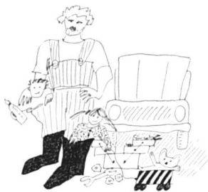
LES DROITS PARENTAUX ... DES DROITS SYNDICAUX !