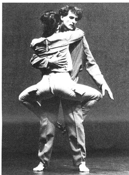
Recoudre les blessures de la guerre des sexes.

La salle est immense, ou plutôt paraît immense à cause des miroirs qui recouvrent complètement deux des parois en vis-