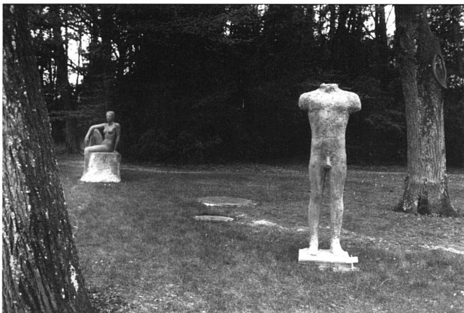
Défaire l'association homme = mental.

Même remarque à propos d'une autre des activités de l'eutoniste, qui anime, en tandem avec une femme médecin, et sous la supervision d'une femme psychiatre, un groupe de thérapie mixte pour des femmes entre 45 et 60 ans qui doivent affronter les deuils caractéristiques de cette tranche d'âge au féminin: émancipation des enfants, vieillissement physique, désillusion quant à la réalité de l'amour romantique, solitude à la suite d'un divorce ou d'un veuvage, ou consolidation, pour les célibataires, d'une solitude qu'on avait espéré provisoire, renoncement définitif à une activité professionnelle ou difficultés liées au