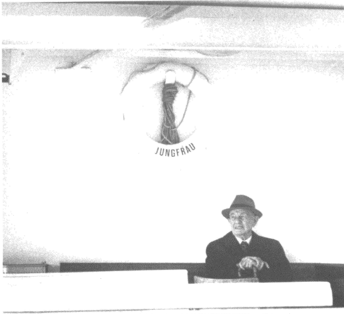
Ô femme immaculée, ne descends pas dans l'arène politique!

d'un terrain intéressant, crédible et favorable aux analyses, recherches et réflexions inhérentes à la problématique « femme et politique ».