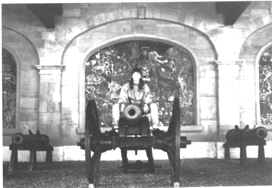
Partager les sièges à Genève? Devant l'Hôtel de Ville, l'assaut a déjà commencé...

Plus étendue que Conseil national 2000, elle demande que «toutes les autorités fédérales, cantonales ou communales assurent aux femmes et aux hommes une présence et des droits égaux».