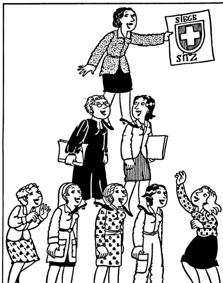
Une femme représente-t-elle toutes les femmes ?

Des cinq partis engagés dans la lutte pour la Chambre basse, seul le Parti radical