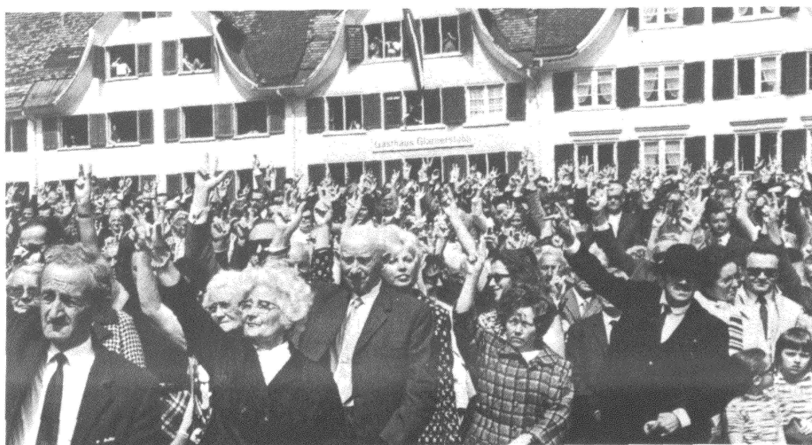
Beaucoup d'eau a coulé sous les ponts depuis le 7 mai 1972, date de la première Landsgemeinde de Glaris où participaient les femmes.

Pas de listes séparées au Parti radical, qui laisse à sa base le soin de composer