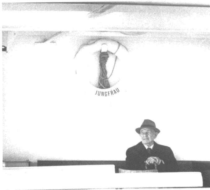
Ô femme immaculée, ne descends pas dans l'arène politique!

d'un terrain intéressant, crédible et favorable aux analyses, recherches et réflexions inhérentes à la problématique « femme et politique ».