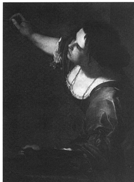
Artemisia Gentileschi - L'art de peindre (autoportrait).

Devant le tribunal, elle a dû subir la torture pour prouver qu'elle disait la vérité.