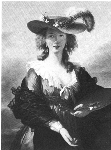
Elisabeth Vigée-Lebrun - Autoportrait avec un chapeau de paille.

A 24 ans, elle part en Angleterre et y rencontre un tel succès avec ses portraits de nobles anglais qu'avant la fin de l'année elle peut s'acheter une maison. Elle est reçue chez les meilleurs artistes, on raconte