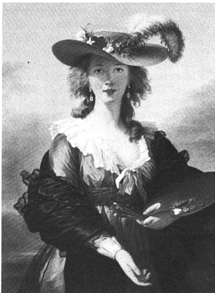
Elisabeth Vigée-Lebrun - Autoportrait avec un chapeau de paille.

A 24 ans, elle part en Angleterre et y rencontre un tel succès avec ses portraits de nobles anglais qu'avant la fin de l'année elle peut s'acheter une maison. Elle est reçue chez les meilleurs artistes, on raconte