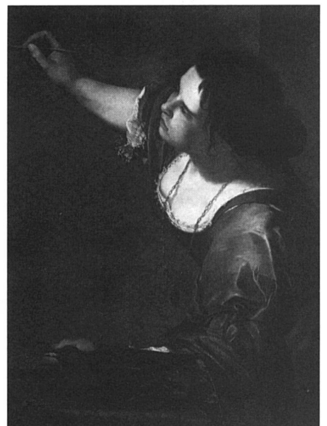
Artemisia Gentileschi - L'art de peindre (autoportrait).

Devant le tribunal, elle a dû subir la torture pour prouver qu'elle disait la vérité.