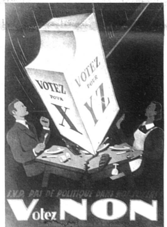
Affiche des adversaires de l'introduction du suffrage féminin sur le plan communal à Neuchâtel, 1941.

Le livre de Lotti Ruckstuhl, ancienne présidente de l'Association suisse pour le suffrage féminin, rend compte de cette histoire trop peu connue.