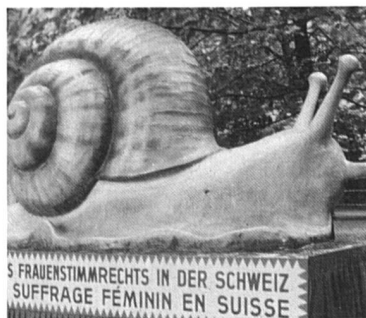
L'escargot du suffrage à la SAFFA de 1928.