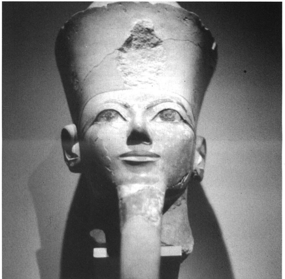
Son père voit en elle la réincarnation de la femme pharaon Hatshepsout.