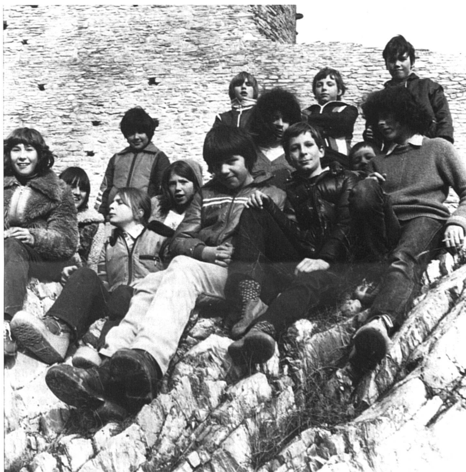
A treize ans, que savent-il?

– il est assis sur son banc d'école 305 minutes par jour, contre un maximum de