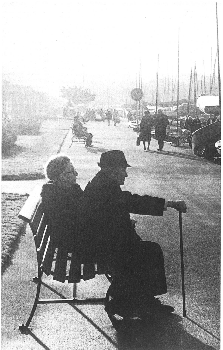
Toutes et tous devraient avoir droit à une retraite digne de ce nom.

Les prestations sont versées aux rentiers AVS selon les cotisations qu'ils ont payées au cours de leur vie active, la rente maximale pouvant atteindre le double de la rente minimale. Employeurs et pouvoirs publics participent solidairement au financement. Le premier pilier est indépendant de l'inflation et ne dépend que de la démographie. La pyramide des âges s'inverse