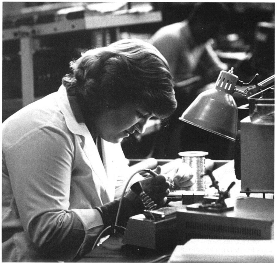
Le montage électronique, l'un des domaines où les besoins de la productivité impliquent un travail de nuit.