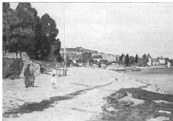
«La Grève de Rolle» de Charles Chinet, 1942