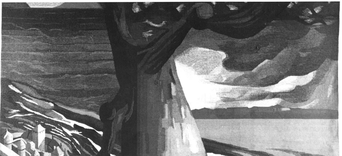
«Le Léman», 1981 haute lice, soie et laine, 177 x 300 cm. Collection Banque Cantonale Vaudoise