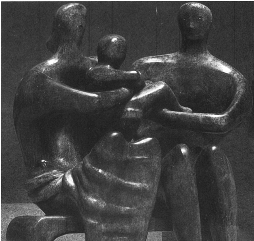
Un vif désir d'enfant met chaque couple stérile devant leur propre conscience.

(Sculpture d'Henry Moore, Fondation Gianadda)