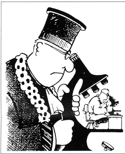
Dessin de Plantu tiré du Monde du 3 mars 1989.

Plus de vingt ans après les premières tentatives, l'OMS soulignait d'ailleurs, en juin 1990, que la FIV et les technologies connexes n'ont toujours pas fait l'objet d'une évaluation appropriée et que les recherches ont essentiellement porté sur le perfectionnement des protocoles techniques et l'élargissement des indications et des techniques.