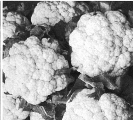
Bien que détaillé concernant l'être humain, le projet reste imprécis au sujet de l'utilisation du patrimoine génétique des plantes et des animaux.

les enjeux économiques et sociaux ont bien été mesurés. Outre le secteur médical, les nouvelles technologies de la reproduction touchent des rouages gigantesques de notre économie comme la chimie et l'industrie pharmaceutique. Les technologies nouvelles coûtent cher. Qui les financera et à qui profiteront-elles? A une poignée de financiers ou à l'humanité tout entière? La question est d'ordre éthique: quelle société allons-nous promouvoir?