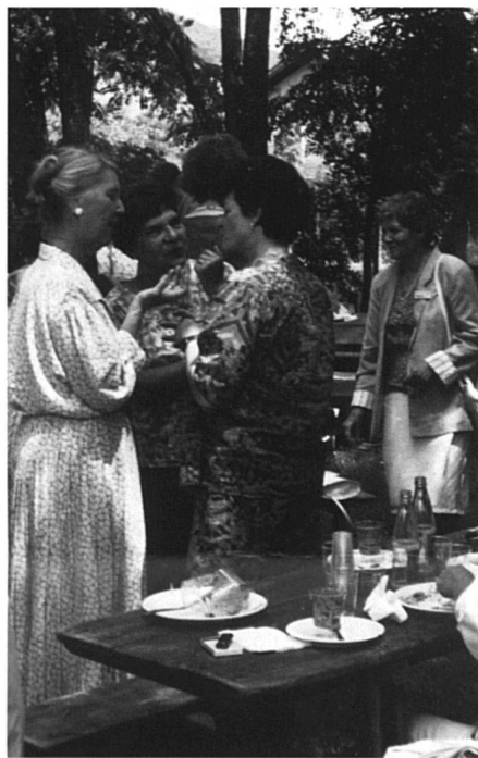
Un thème qui mérite que l'on prolonge la discussion durant le buffet.

Pour combler ce fossé, un secrétariat national aux Droits des femmes a été mis sur pied dès 1974. Ainsi, 26 déléguées régionales et une déléguée par département travaillent au sein de cet organe de défense.