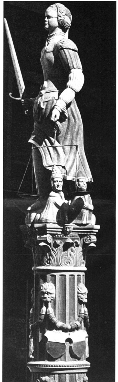
Plus de justice dans le partage des créances.

Le rapport fait plusieurs fois référence aux droits du parent non gardien, notamment à son droit de visite, mais il ne propose rien pour encourager l'exercice concret de ce droit. Ce droit apparaît comme dénué de tout devoir, ce qui correspond à la conception traditionnelle en la matière. Or, il me semble que nous devrions innover sur ce point, pour deux raisons: d'une part, il