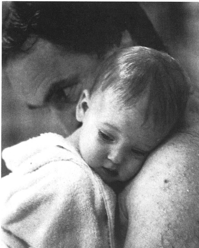
L'homme nouveau est-il vraiment arrivé?

Si cette revue vous intéresse, elle peut être commandée au prix de Fr. 8.50 auprès du département romand de Pro Juventute, rue Caroline 1, 1003 Lausanne. Tél. (021) 23 50 91.