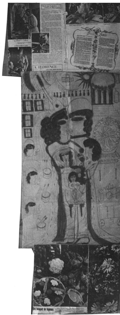
2. Peintre Bucci di Lorenzo reine Juliana (70x40 cm).