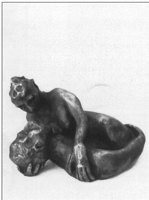
Le Couple, thème favori de Madeleine Jost.

molasse, façonner la glaise, à la fois résistante et soumise, pour en créer le modèle qui se transformera en statue de bronze, permet à Madeleine Jost d'exprimer ses sentiments les plus profonds. Plus facilement qu'avec les mots, l'image se forme, de manière immédiate, et les mains la