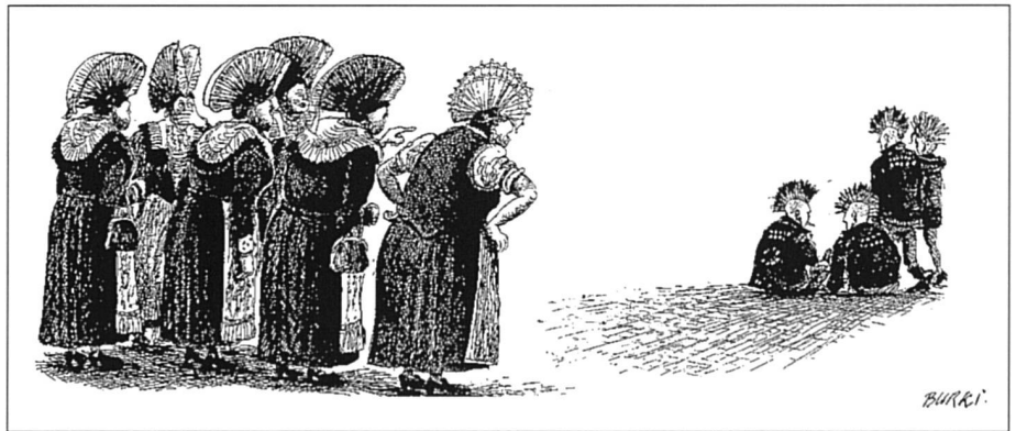
Des clivages dans le tissu social, politique et culturel de notre pays.

Pendant la campagne référendaire, il y a eu abondance d'information, mais manifestement déficit quant à la communication. FS a bien une vocation nationale. Malheureusement, il n'y a plus actuellement en Suisse alémanique de journal ayant une tendance analogue à la sienne avec lequel